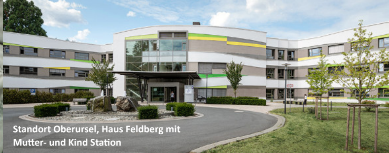
Standort Oberursel, Haus Feldberg mit Mutter- und Kind Station