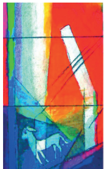
Bild von Andreas Felger (2007): „Das verlorene Schaf“ Das Original dieses Bildmotives finden Sie als Glasfenster im Raum der Stille.

Der Herr ist mein Hirte, mir wird nichts mangeln. Er weidet mich auf einer grünen Aue und führet mich zum frischen Wasser. Er erquicket meine Seele. Er führet mich auf rechter Straße um seines Namens willen.